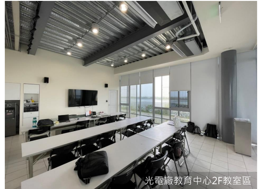
光電廠教育中心2F教室區