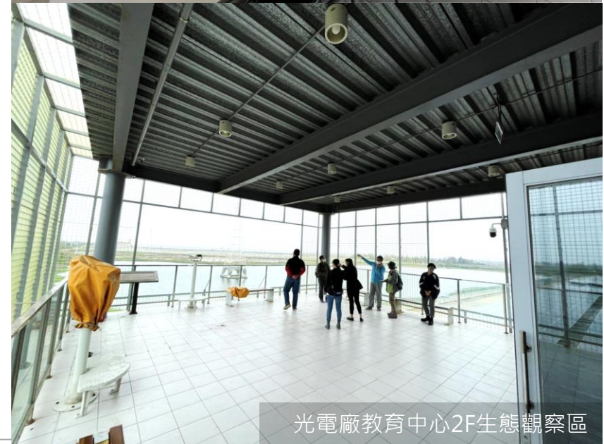
光電廠教育中心2F生態觀察區