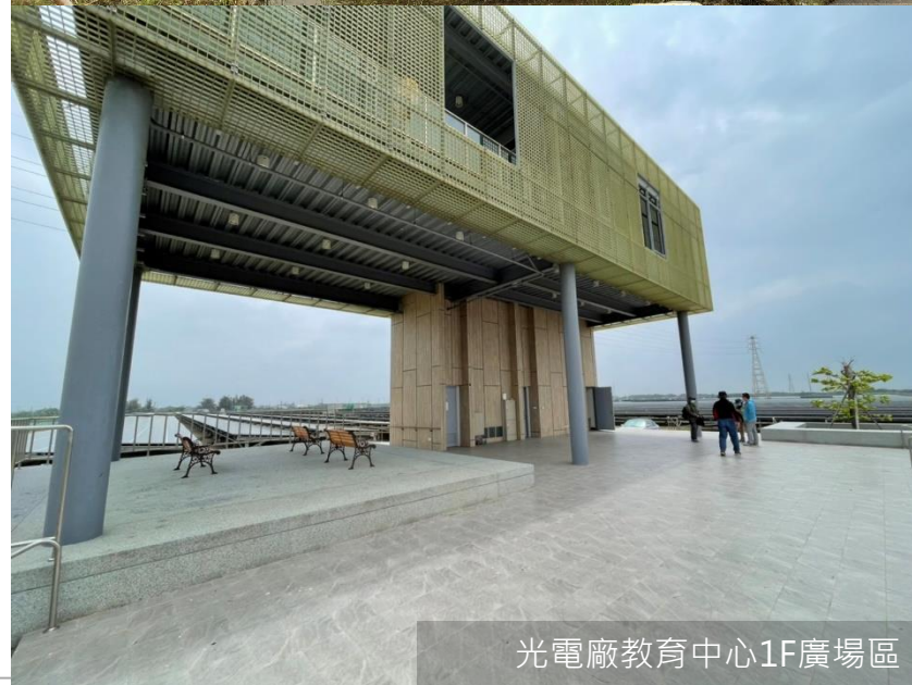
光電廠教育中心1F廣場區