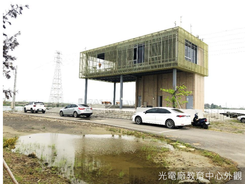
光電廠教育中心外觀