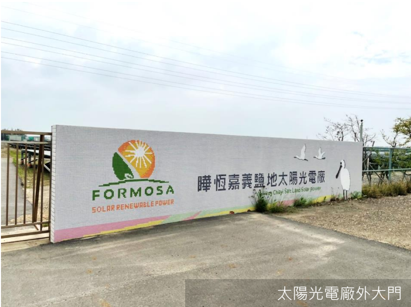
太陽光電廠外大門